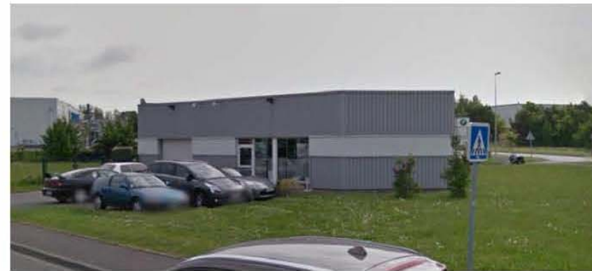
DP 7 - Visuel de près d'état existant