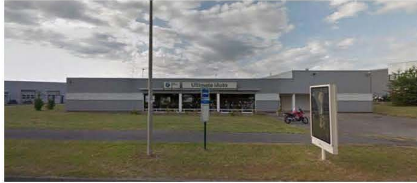
DP 8 - Visuel de loin d'état existant