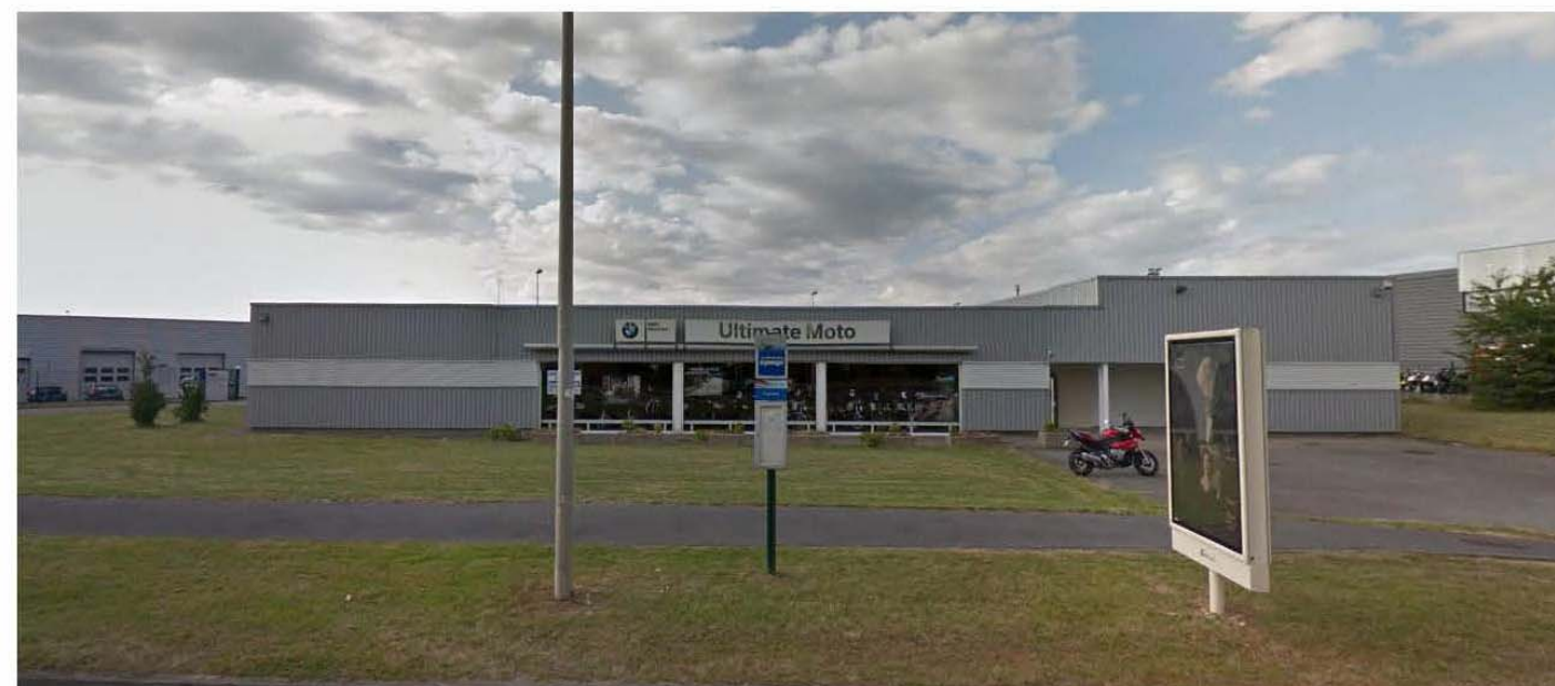
DP 8a - Visuel photographique de loin