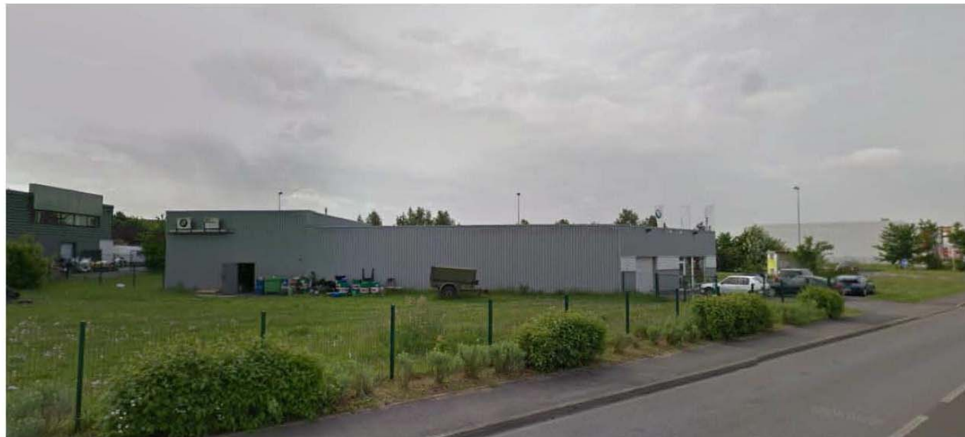
DP 8b - Visuel photographique de loin