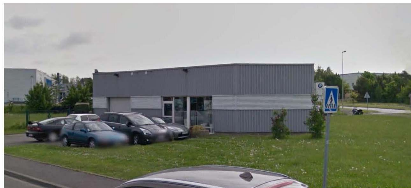
DP 7 - Visuel photographique de près