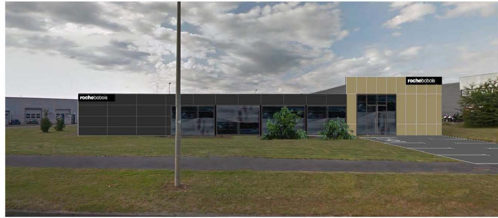
DP 6a - Visuel de loin d'état projeté