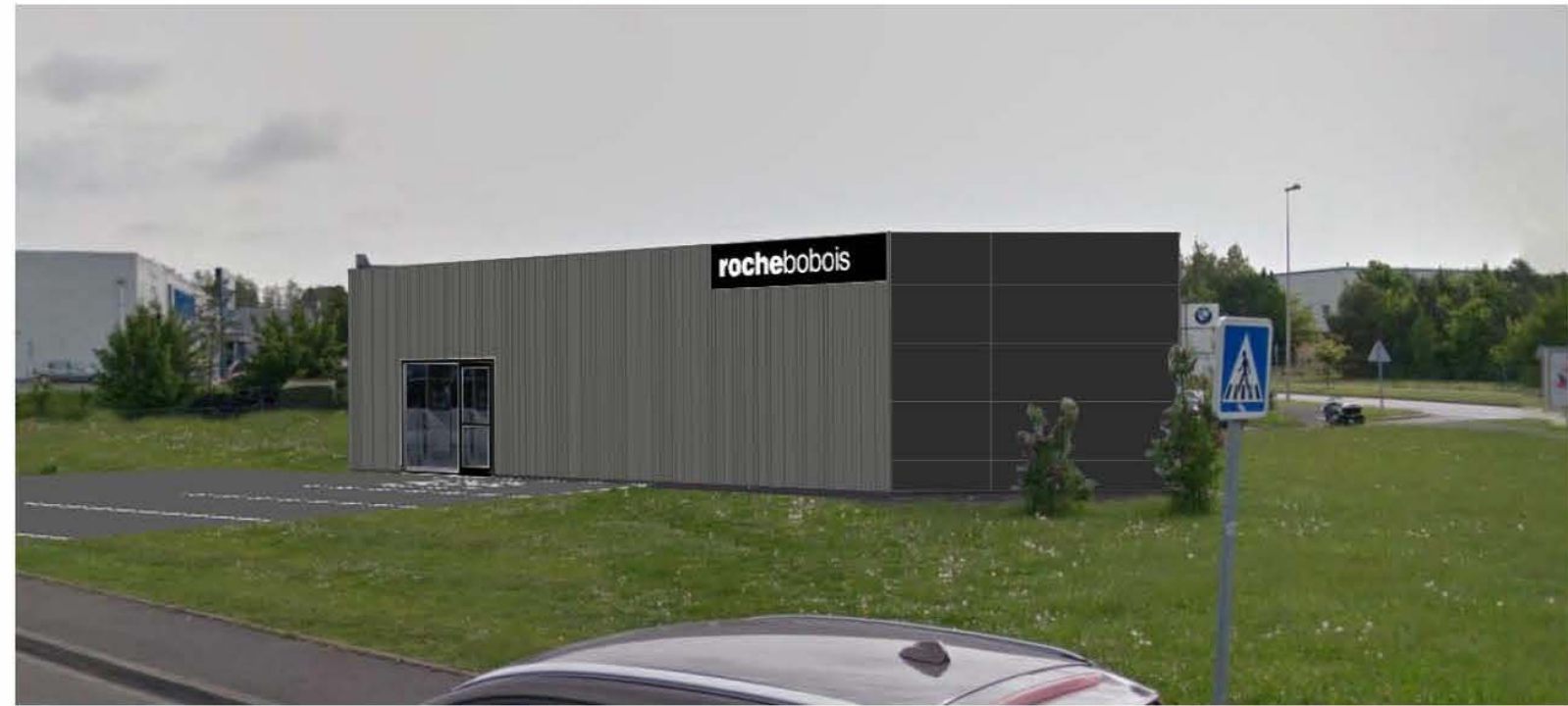
DP 6b - Visuel de près d'état projeté